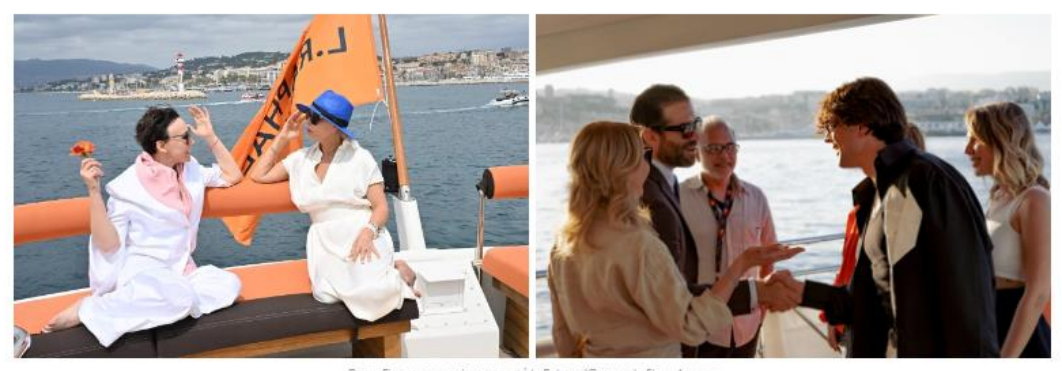
Darya Examasova, qui a remporte la Palme d'Or pour le film « Anora » Viadislav Tsenev reçu par Ronit Raphael